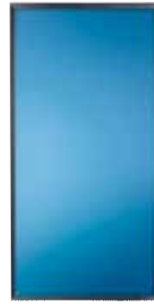
NIBE Aurinkopaneelit NIBE Solar FP215 P *Tuotenumero 057001 (3 kpl)