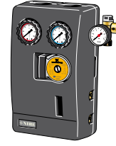
NIBE Aurinkopumppuasema SPS10 *Tuotenumero 057027 (1 kpl)