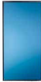
NIBE Aurinkopaneelit NIBE Solar FP215 P *Tuotenumero 057001 (3 kpl)

NIBE Aurinkopumppuasema SPS20 *Tuotenumero 057038 (1 kpl)