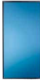
NIBE Aurinkopaneelit NIBE Solar FP215 P / PL *Tuotenumero 057001 (P) *Tuotenumero 057002 (PL) (2 – 3 kpl)