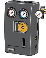
NIBE Aurinkopumppuasema SPS10 *Tuotenumero 057027 (1 kpl)