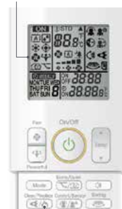
Kaukosäätimen takkatoiminnon aktivointinäppäin